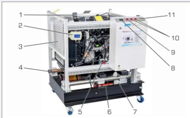
1 Anschluss für Motorzuluft, 2 Kühlwasserbehälter, 3 Kühler mit Schutzgitter, 4 Abgasanschluss, 5 Batterie-Hauptschalter, 6 Batterie, 7 Behälter für Kraftstoff, 8 Betriebsstundenzähler, 9 Motorkontrollleuchte, 10 Warnleuchten, 11 Schlüsselschalter für Zündung