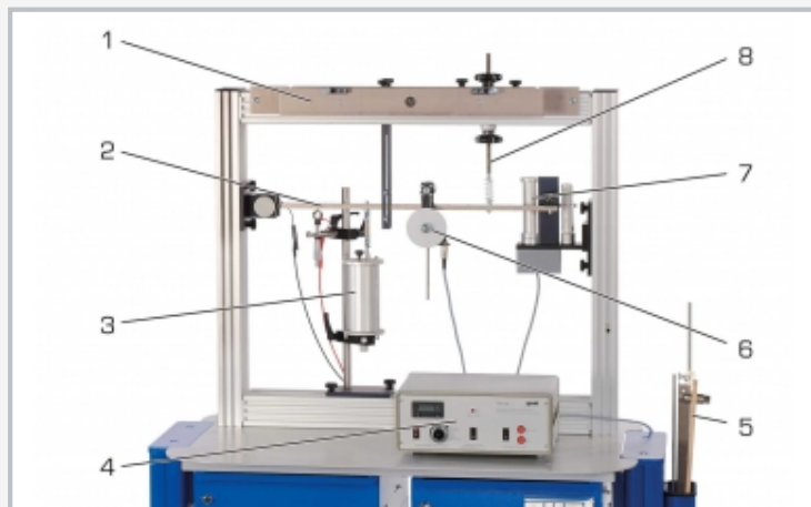
1 alojamiento de péndulo, 2 oscilador de viga, 3 depósito del amortiguador de aceite, 4 equipo de mando para excitador de desequilibrio, 5 bandeja para otros péndulos, 6 excitador de desequilibrio, 7 registrador de tambor, 8 muelle