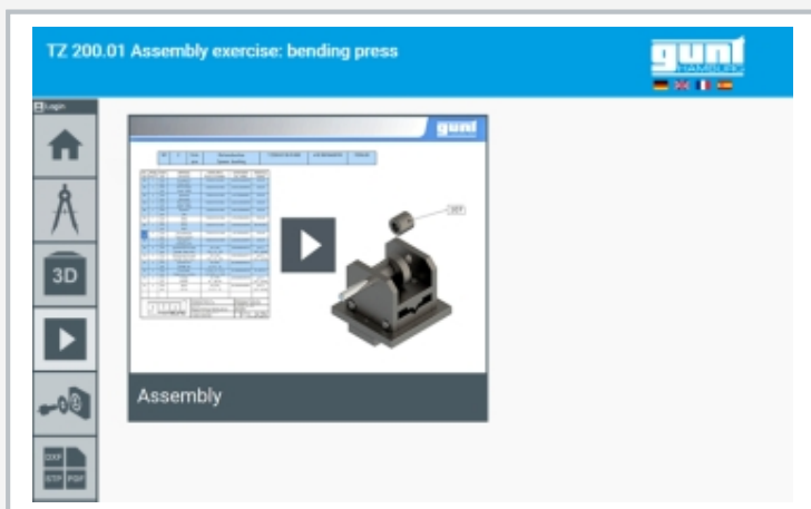
Captura de pantalla del GUNT Media Center: video de montaje