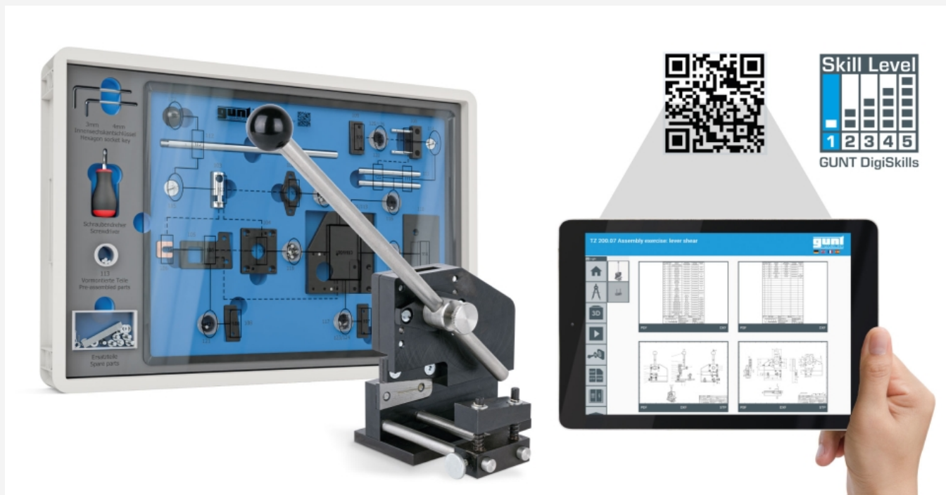
La ilustración muestra el dispositivo y el GUNT Media Center, tablet no incluida