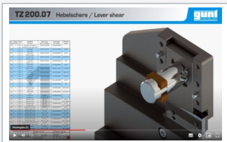
Captura de pantalla del GUNT Media Center: video de montaje