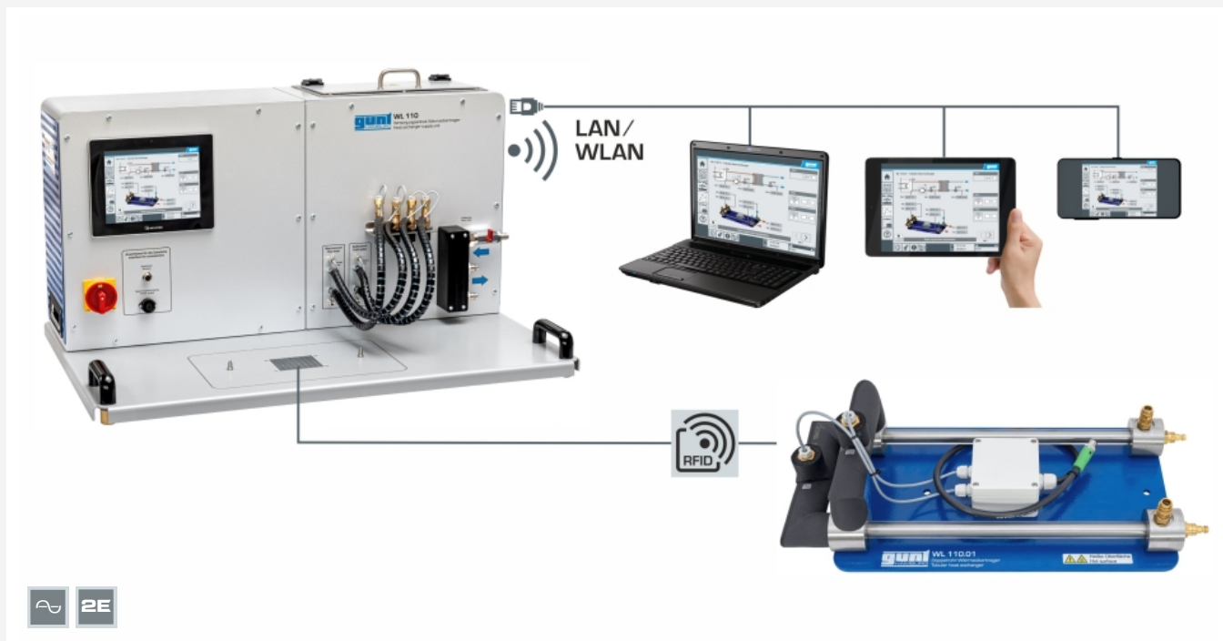
L'illustration montre l'unité d'alimentation WL 110 et les accessoires WL 110.01, possibilité de "screen mirroring" sur 10 terminaux maximum