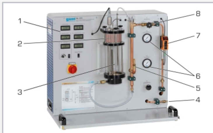
1 panel de indicadores y de mando, 2 filtro de aire, 3 reactor de vidrio iluminado por detrás, 4 toma de aire comprimido, 5 válvula de seguridad, 6 manómetro, 7 flujómetro, 8 válvula para ajustar la cantidad de aire