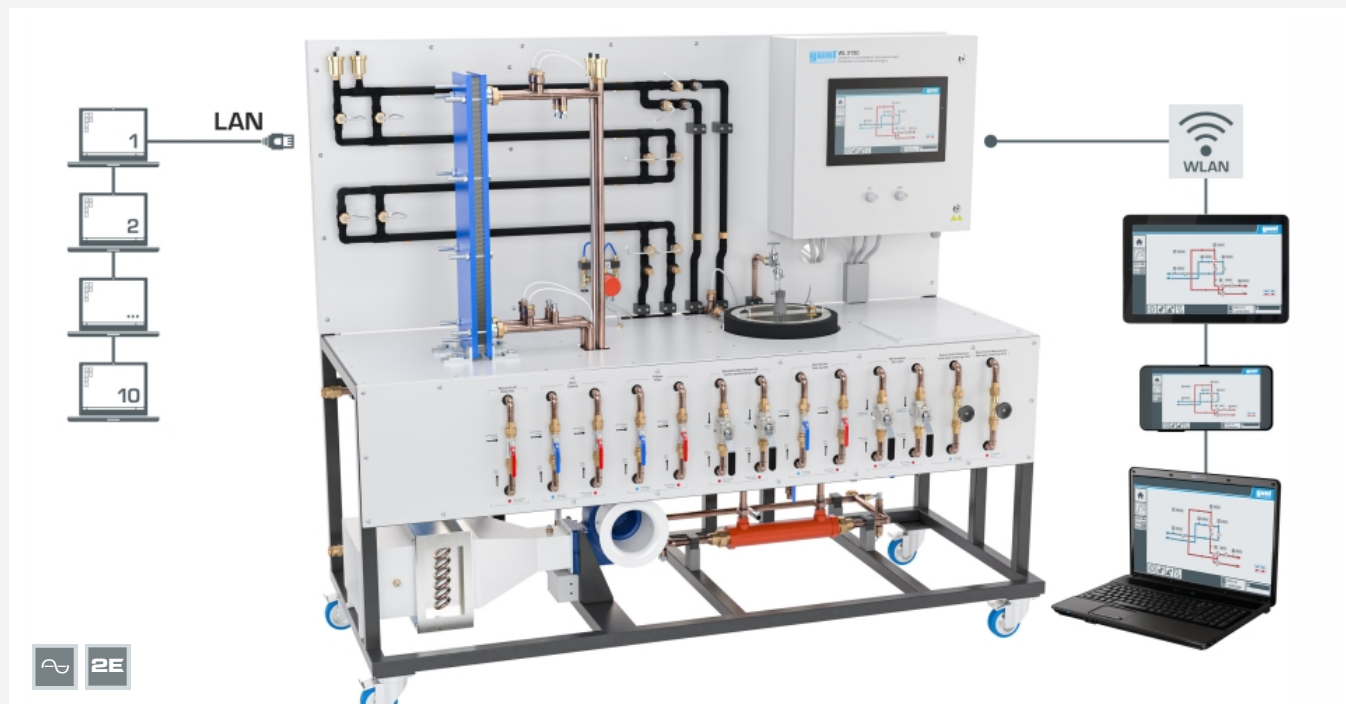
Screen-Mirroring ist an bis zu 10 Endgeräten möglich