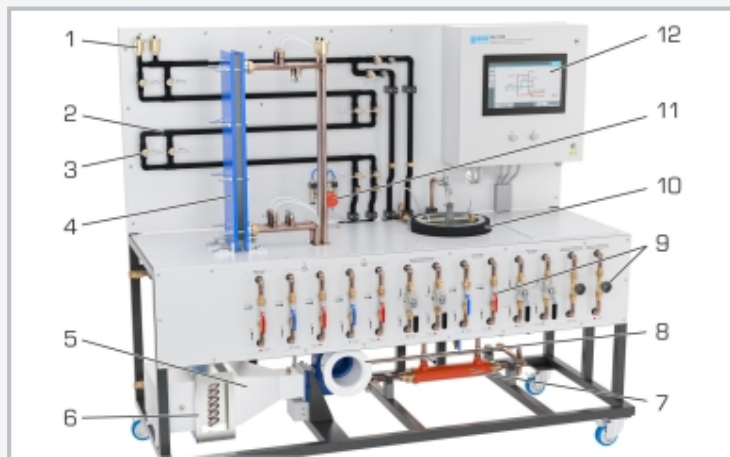
1 Entlüftungsventil, 2 Doppelrohr-Wärmeübertrager, 3 Temperaturenfnehmer, 4 Platten-Wärmeübertrager, 5 Luftkanal, 6 Rippenrohr-Wärmeübertrager, 7 Rohrbündel-Wärmeübertrager, 8 Gebläse, 9 Verstellarmaturen, 10 Rührbehälter mit Doppelmantel und Rohrschlange, 11 Druckaufnehmer (Wasser), 12 SPS mit Touchscreen