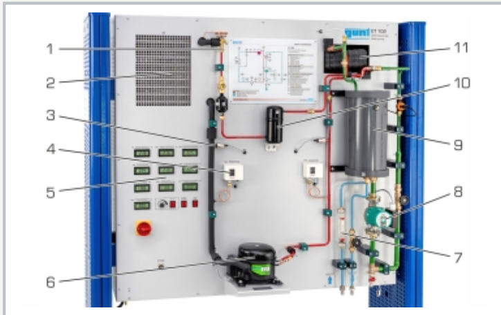
1 soupape de détente, 2 condenseur avec ventilation, 3 capteur de pression, 4 pressostat, 5 éléments d'affichage et de commande, 6 compresseur, 7 débitmètre eau de refroidissement, 8 pompe, 9 réservoir d'eau chaude, 10 réservoir, 11 condenseur