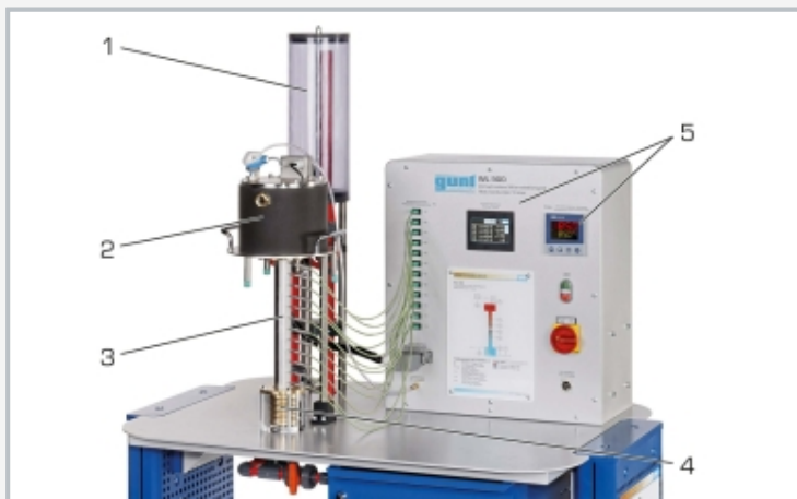
1 réservoir élevé pour pression d'admission constante de l'eau de refroidissement, 2 source de chaleur avec dispositif de chauffage, 3 éprouvette, 4 dissipateur thermique refroidi par eau, 5 éléments d'affichage et de commande