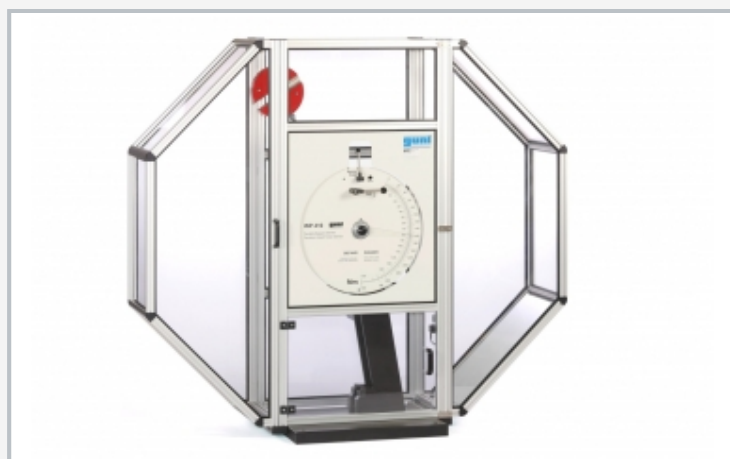
Pantalla protectora para aparato percusor de péndulo WP 410.50 disponible a modo de accesorio