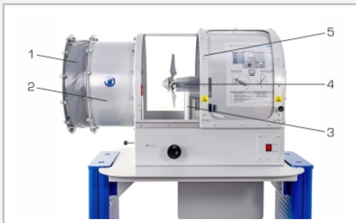
1 conexión para el túnel de viento HM 170, 2 rectificador de flujo, 3 torre, 4 central eólica, 5 cubierta protectora