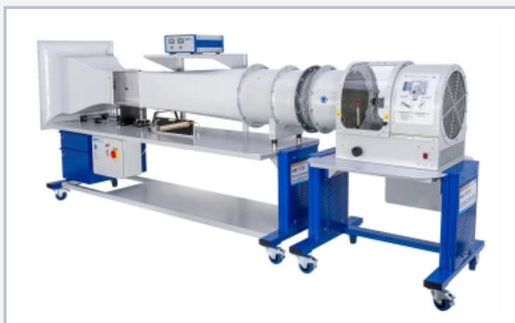
Túnel de viento abierto HM 170 con HM 170.70