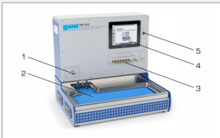
1 raccord d'eau pour accessoires, 2 réservoir de stockage avec insert en mousse, 3 raccords de mesure de pression, 4 écran tactile, 5 raccordement USB