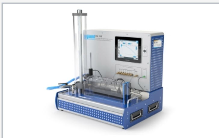
L'illustration montre l'accessoire HM 250.06 sur la surface de travail du module de base HM 250