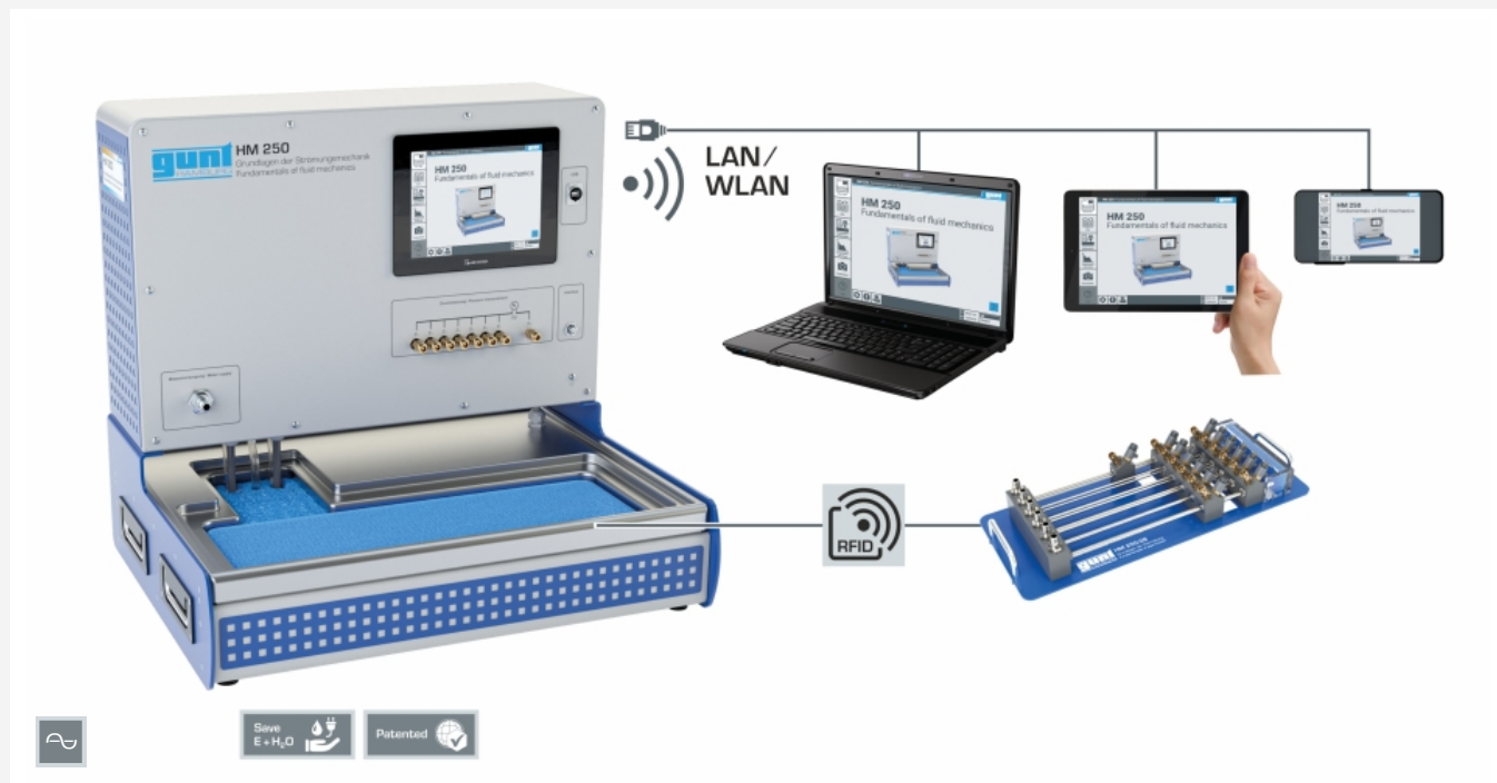
L'illustration montre le module de base HM 250 à gauche et l'accessoire HM 250.09 à droite, possibilité de "screen mirroring" sur 10 terminaux maximum