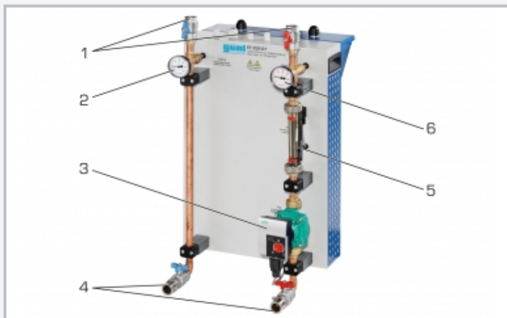
1 circuit entrant/sortant de l'ET 352, 2 thermomètre du circuit sortant, 3 pompe de circulation, 4 circuit entrant/sortant du HL 313, 5 capteur de débit, 6 thermomètre du circuit entrant