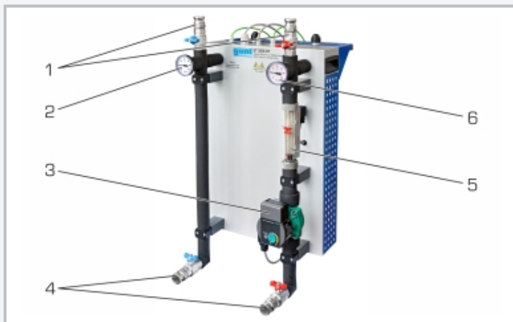
1 Vor-/Rücklauf ET 352, 2 Thermometer Rücklauf, 3 Umwälzpumpe, 4 Vor-/Rücklauf HL 313, 5 Durchflussaufnehmer, 6 Thermometer Vorlauf