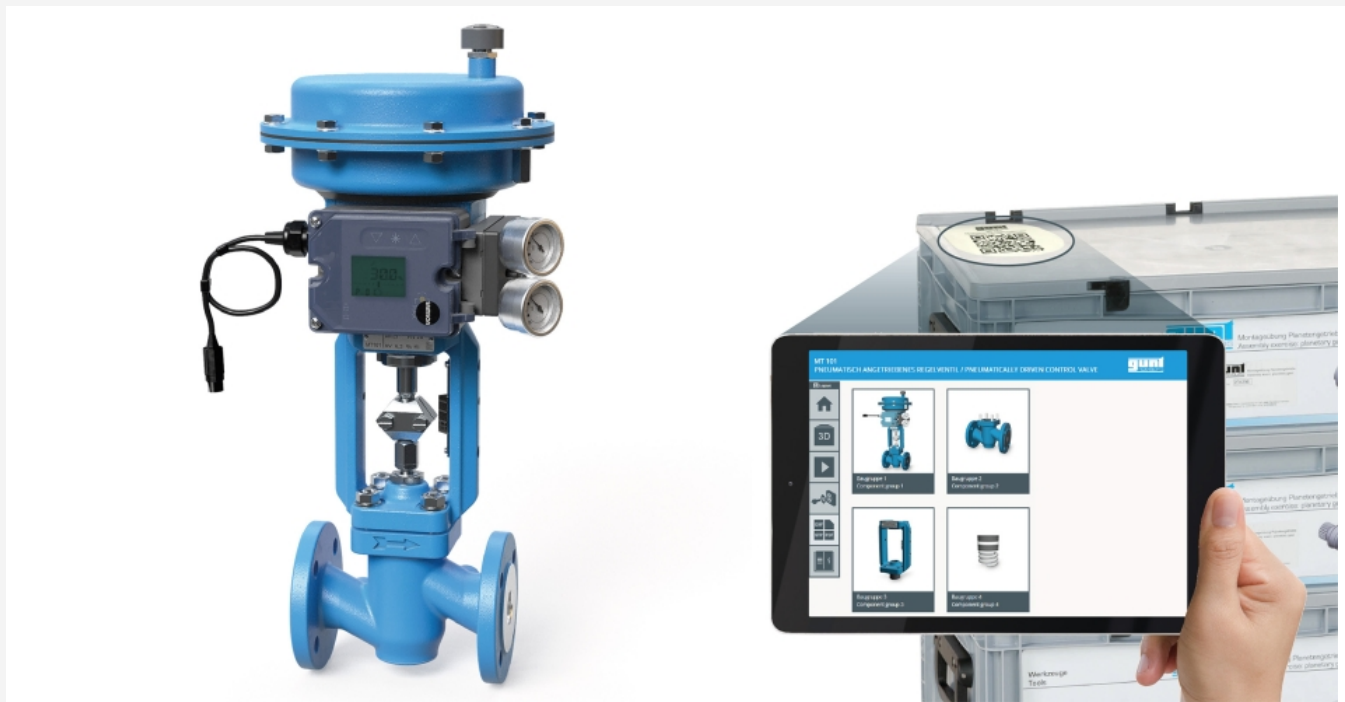
L'illustration montre la vanne de régulation montée et le GUNT Media Center sur une tablette (non comprise)