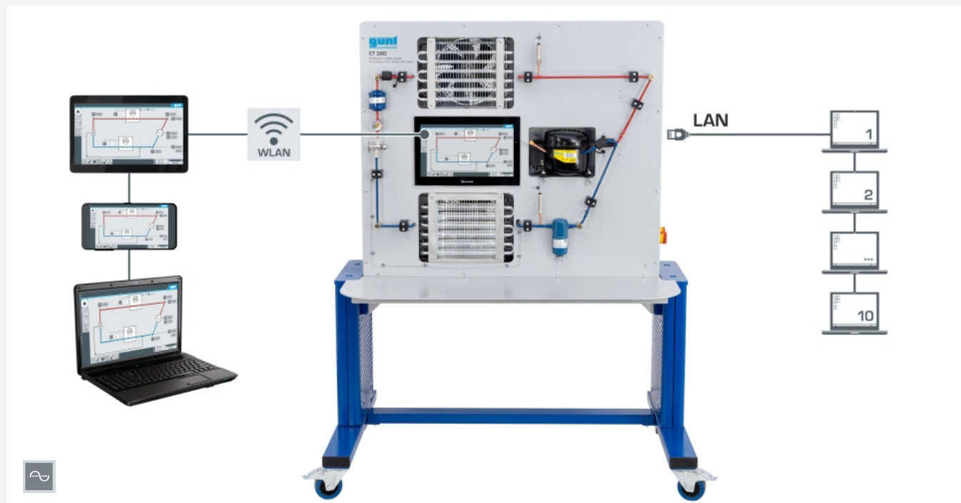
"screen mirroring" es posible con hasta 10 dispositivos finales