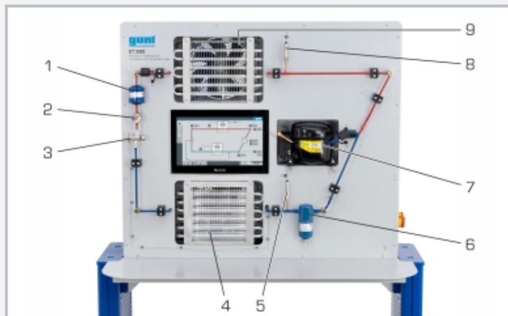
1 filtro/secador, 2 mirilla con indicador de humedad, 3 válvula de expansión termostática (VET), 4 evaporador con ventilador, 5 sensor de presión (baja presión), 6 separador de líquido, 7 compresor, 8 sensor de presión (alta presión), 9 condensador con ventilador