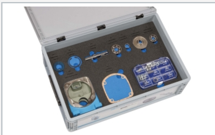
MT 120: Aufbewahrungssystem mit Schaumstoffeinlage, alle Komponenten haben ihren festen Platz, der Schaum ist beschriftet