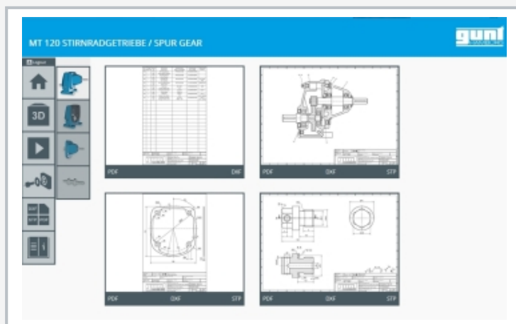
Screenshot des GUNT Media Centers