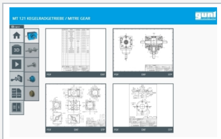
Screenshot des GUNT Media Centers