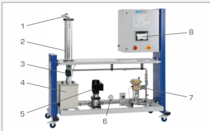
1 capteur de niveau intelligent, 2 réservoir transparent, 3 vanne proportionnelle à entraînement motorisé, 4 réservoir de stockage, 5 pompe, 6 manomètre, 7 vanne de régulation, 8 écran tactile