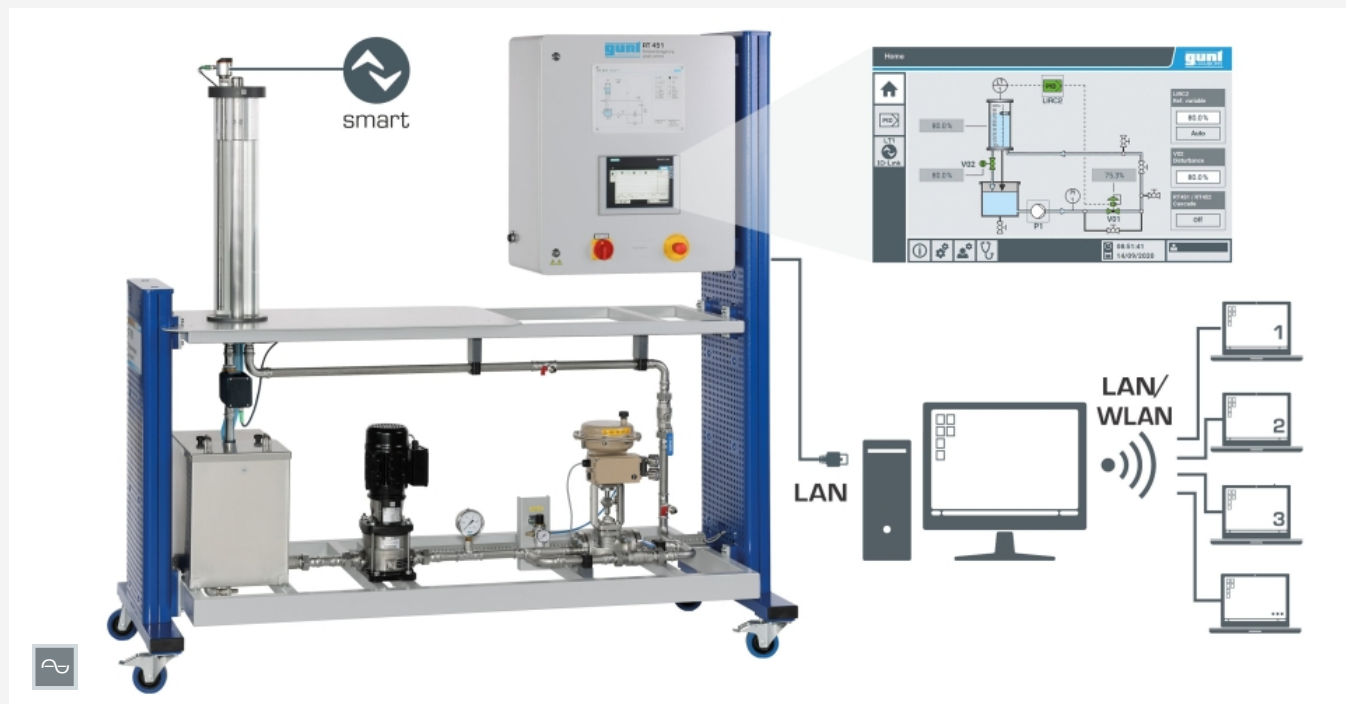
Commande et exploitation via écran tactile ou un PC équipé du logiciel GUNT. Observation et évaluation des essais sur un nombre illimité de postes de travail via LAN/WLAN.