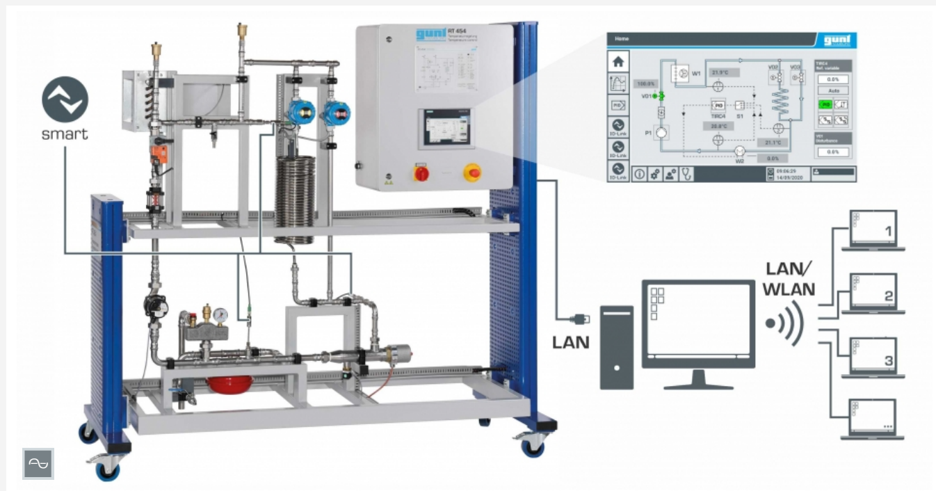
Commande et exploitation via un écran tactile ou un PC équipé du logiciel GUNT. Observation et évaluation des essais sur un nombre illimité de postes de travail via LAN/WLAN.