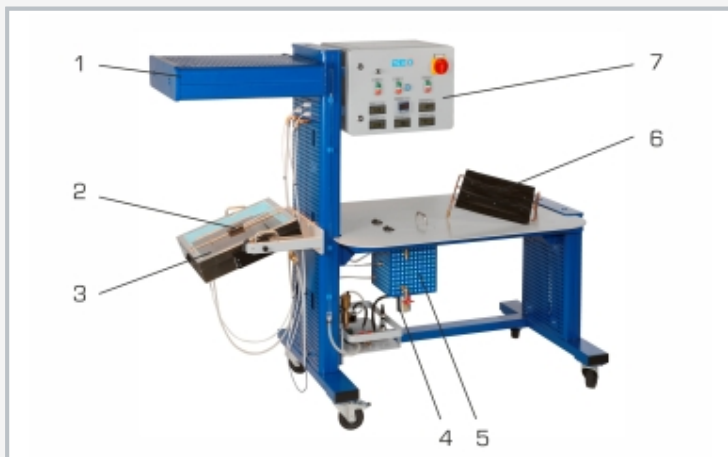
1 unidad de alumbrado, 2 sensor de iluminancia, 3 colector plano con ajuste de distancia e inclinación, 4 calefacción eléctrica adicional, 5 depósito, 6 absorbedor removible, 7 armario de distribución