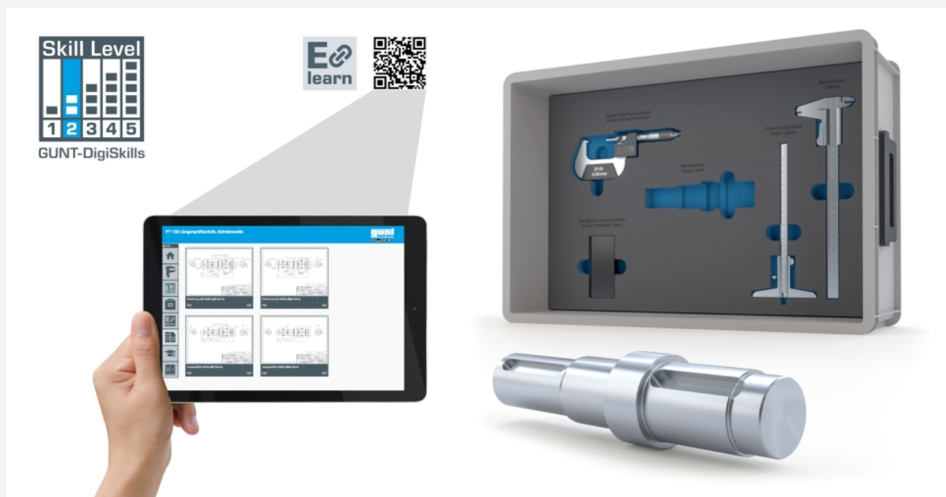
Die Abbildung zeigt das Gerät und das GUNT Media Center auf einem Tablet (nicht im Lieferumfang enthalten).