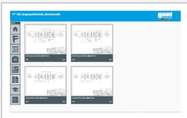
Screenshot GUNT Media Center