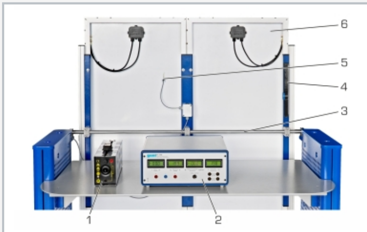
1 Schiebewiderstand, 2 Messverstärker, 3 Kippachse für Neigungsverstellung, 4 Neigungsmesser, 5 Temperaturenfnehmer, 6 Photovoltaikmodule