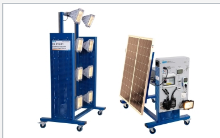
L'illustration montre ET 250.01 avec ET 250 et une source lumineuse artificielle HL 313.01

1 disjoncteur à courant continu avec protection contre les surtensions, 2 onduleur avec tracker MPP, 3 compteur de courant bidirectionnel pour l'alimentation du réseau, 4 alimentation du réseau, 5 compteur de courant d'énergie pour consommation propre, 6 lampe halogène avec variateur de lumière