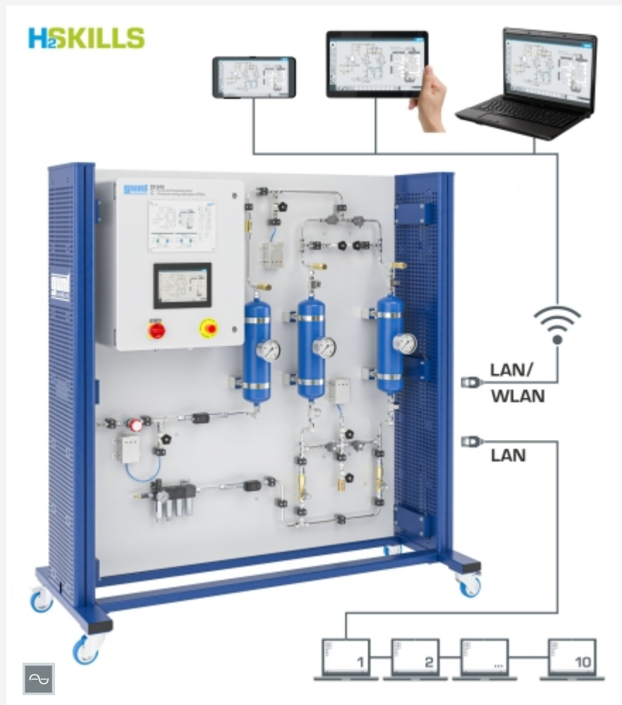
possibilité de "screen mirroring" sur 10 terminaux maximum