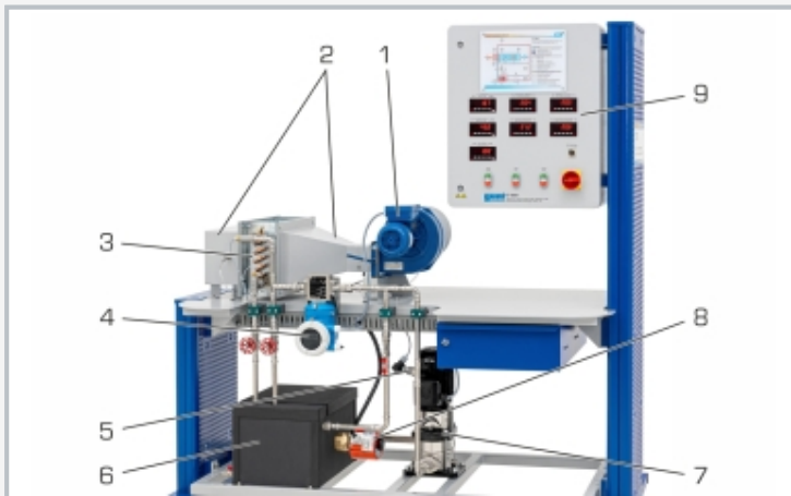
1 Gebläse, 2 Luftkanal mit Temperaturmessstellen, 3 Wärmeübertrager, 4 Durchflussmesser, 5 Druckaufnehmer, 6 Wasserbehälter, 7 Pumpe, 8 Heizer mit Thermostat, 9 Anzeige- und Bedienelemente