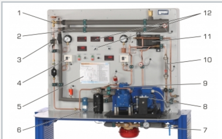
1 Expansionsventil, 2 Verdampfer, 3 Durchflussmesser Kältemittel, 4 Druckschalter, 5 Prozessschema, 6 Sammler, 7 Heißwasserkreislauf des Verdampfers, 8 Antriebsmotor, 9 Verdichter, 10 Durchflussmesser Kühlwasser, 11 Verflüssiger, 12 Anzeige- und Bedienelemente