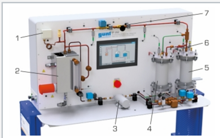
1 pressostat, 2 générateur de vapeur, 3 pompe, 4 évaporateur, 5 condenseur, 6 débit-mètre, 7 compresseur à jet de vapeur