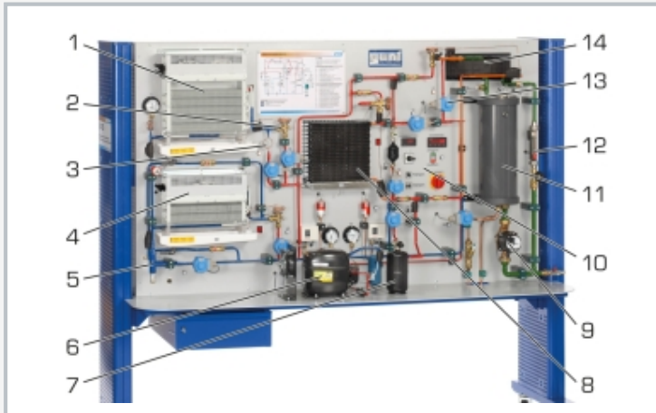
1 Verdampfer, 2 Expansionsventil, 3 Kapillarrohr, 4 Verdampfer Tiefkühlstufe, 5 Verdampfungsdruckregler, 6 Verdichter, 7 Sammler, 8 Wärmeübertrager mit Gebläse, 9 Pumpe, 10 Anzeige- und Bedienelemente, 11 Behälter für Glykol-Wasser-Gemisch, 12 Durchflussmesser (Glykol-Wasser), 13 Magnetventil, 14 Koaxialwendel-Wärmeübertrager