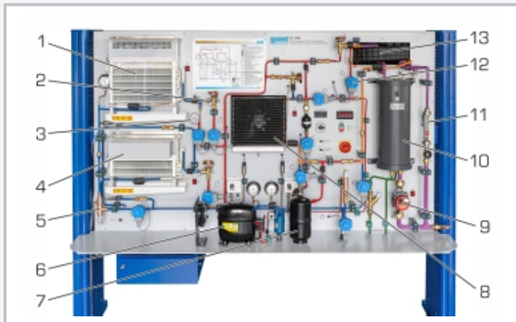
1 Verdampfer, 2 Expansionsventil, 3 Kapillarrohr, 4 Verdampfer Tiefkühlstufe, 5 Verdampfungsdruckregler, 6 Verdichter, 7 Sammler, 8 Wärmeübertrager mit Gebläse, 9 Pumpe, 10 Behälter für Glykol-Wasser-Gemisch, 11 Durchflussmesser (Glykol-Wasser), 12 Magnetventil, 13 Koaxialwendel-Wärmeübertrager