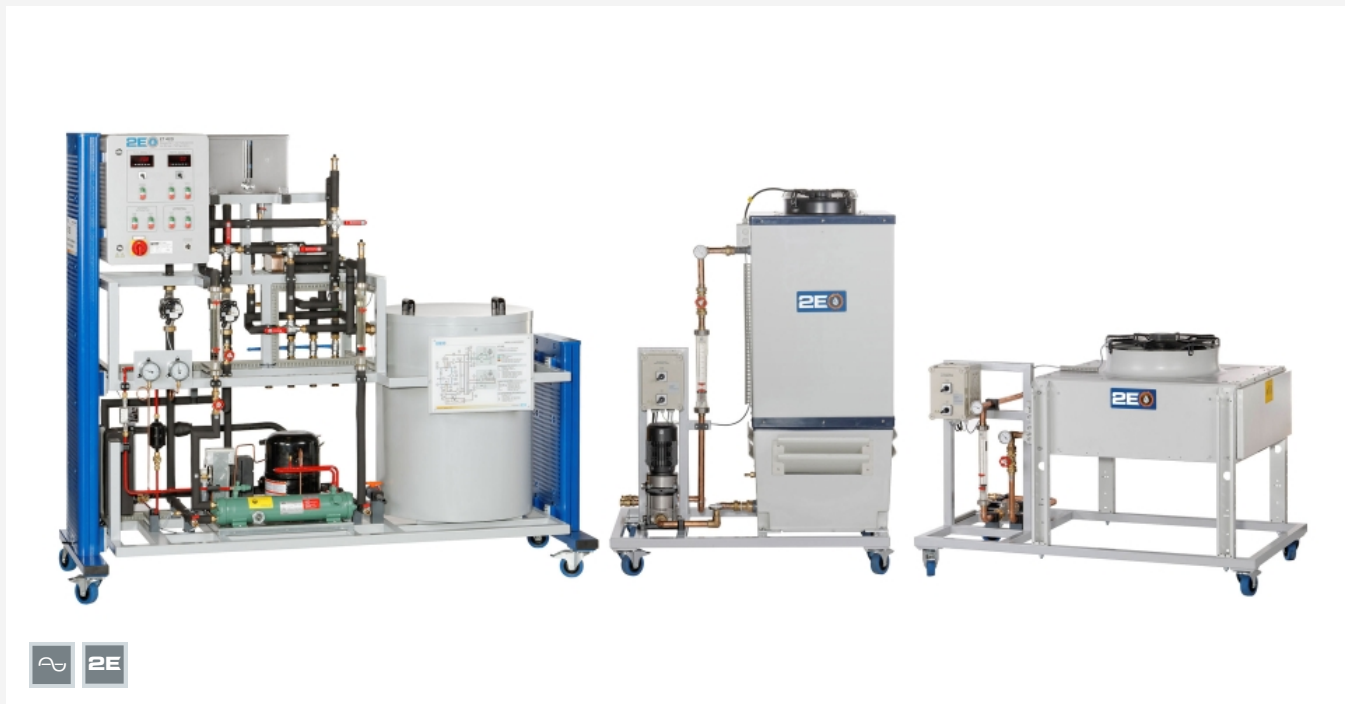
L'illustration montre le banc d'essai à gauche, la tour de refroidissement par voie sèche (à droite) et par voie humide (au milieu).