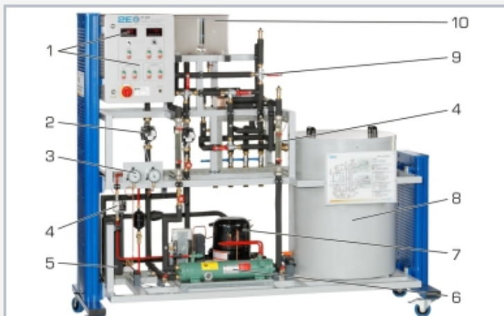
1 éléments d'affichage et de commande, 2 pompe, 3 manomètre, 4 débitmètre, 5 évaporateur, 6 condenseur, 7 compresseur, 8 accumulateur de glace, 9 soupape à 3 voies, 10 réservoir de compensation