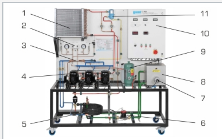
1 condenseur, 2 pressostat, 3 échangeur de chaleur, 4 compresseur, 5 évaporateur, 6 pompe, 7 dispositif de chauffage, 8 réservoir de refroidissement (charge de refroidissement), 9 réservoir, 10 coffret de commande, 11 séparateur d'huile