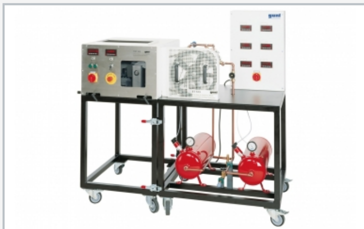
La ilustración muestra un montaje experimental completo del ET 513 y la HM 365