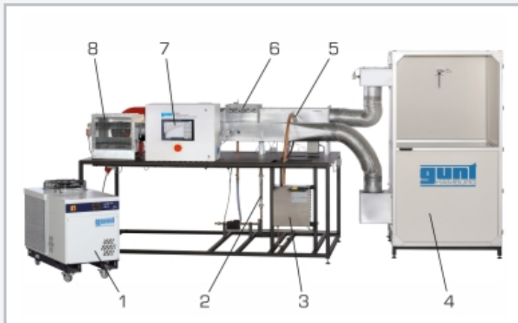
1 Kaltwassersatz, 2 Durchflussmesser, 3 Dampfluftbefeuchter, 4 Klimakammer, 5 Dampfverteiler (Befeuchter), 6 Luftkühler, 7 SPS, 8 Außenlufteintritt mit Gebläse; verdeckt: Lufterwärmer