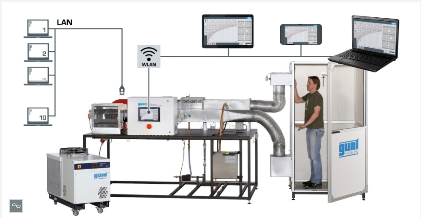
Screen-Mirroring ist an bis zu 10 Endgeräten möglich