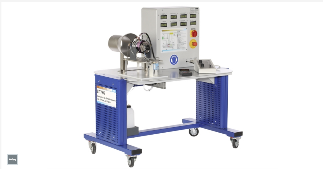
Die Abbildung zeigt das Strahltriebwerk ohne Schutzgitter