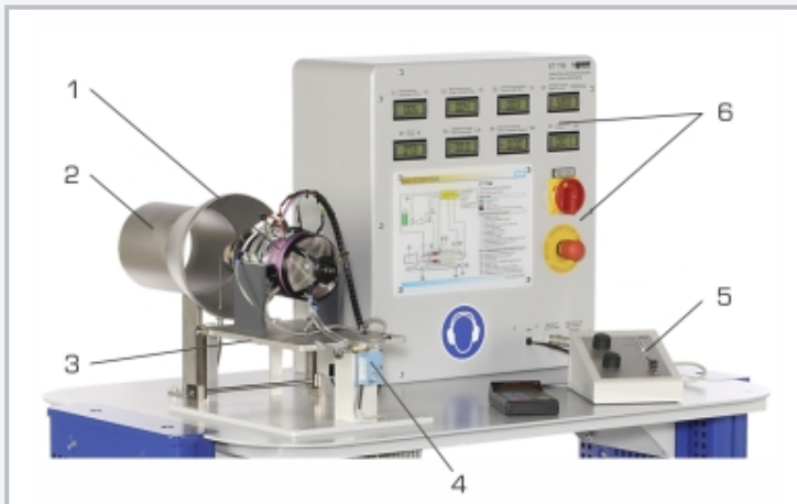
1 Strahltriebwerk, 2 Mischrohr, 3 Turbinentisch, 4 Kraftaufnehmer für Schubmessung, 5 Bedienelemente Gasturbine, 6 Anzeige- und Bedienelemente Versuchsstand