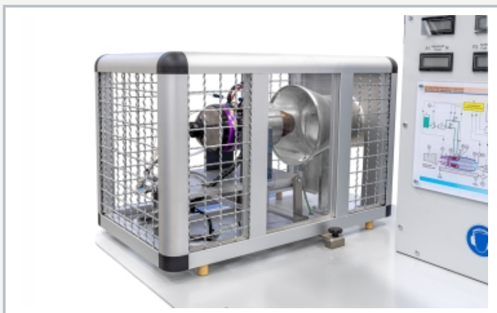
Schutzgitter für Strahltriebwerk