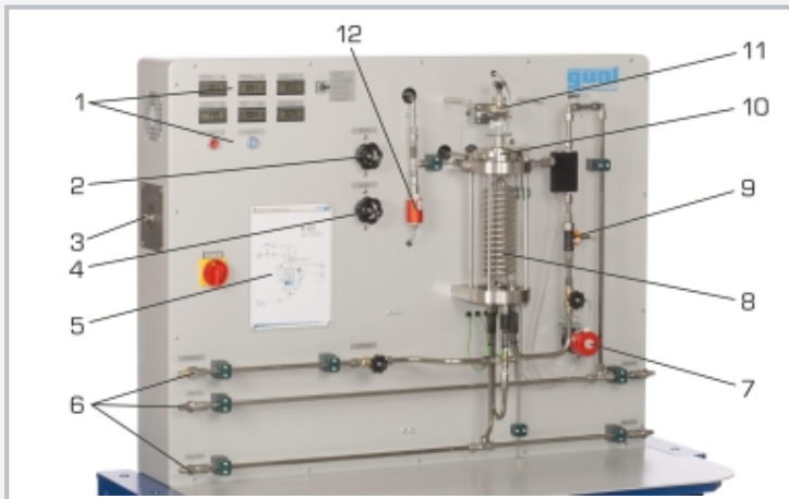
1 Anzeige- und Bedienelemente, 2 Ventil für Sperrdampf, 3 Dampfanschluss, 4 Ventil für Dampfeintritt, 5 Prozessschema, 6 Wasseranschlüsse, 7 Druckaufnehmer zur Kondensatmessung, 8 Kondensator mit Rohrschlange, 9 Durchflussaufnehmer Kühlwasser, 10 Turbine, 11 Wirbelstrombremse, 12 Druckaufnehmer