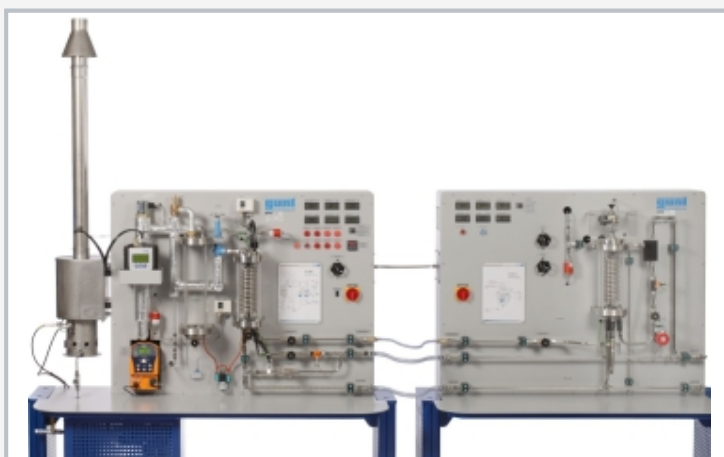
links der Dampferzeuger ET 850 und rechts die axiale Dampfturbine ET 851; betriebsbereit aufgebaut bilden beide gemeinsam eine komplette Dampfkraftanlage