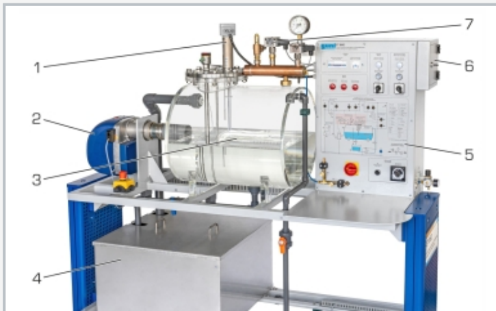
1 Einrichtung zur Überwachung des Wasserfüllstands, 2 Brenner, 3 Dampfkesselmodell, 4 Versorgungsbehälter, 5 Schaltschrank, 6 Schaltkasten für Fehlerschaltung, 7 Druckmesseneinrichtungen