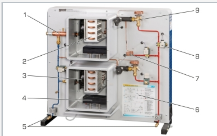
1 régulateur de pression d'évaporation, 2 évaporateur, 3 ventilateur, 4 dispositif de chauffage, 5 raccords à l'ET 915, 6 schéma de processus, 7 tube capillaire, 8 électrovanne, 9 soupape de détente