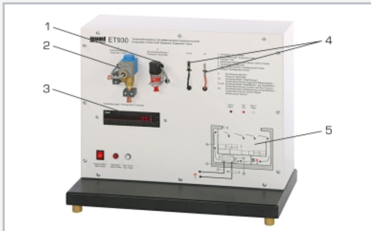
1 Druckaufnehmer, 2 elektronisches Expansionsventil, 3 Display des Kühlstellenreglers, 4 Temperaturlaufnehmer, 5 Schema der simulierten Kühltruhe