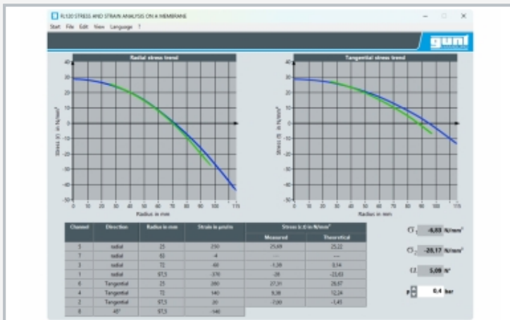
Anwendungssoftware für Spannungsanalysen am Beispiel FL 120 (Spannungsanalyse an einer Membran)