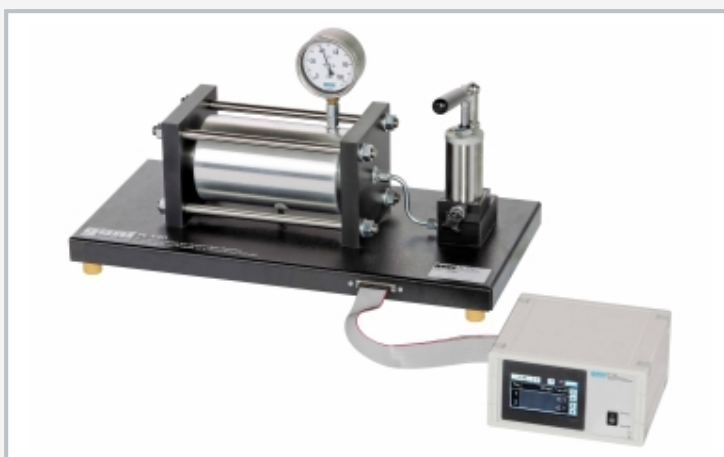
Anwendungsbeispiel: FL 152 in Verbindung mit FL 140 (Spannungsanalyse am dickwandigen Behälter)