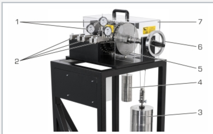
1 relojes comparadores, 2 vigas de flexión, 3 juego de pesas, 4 juego de pesas para la medición de las relaciones de transmisión, 5 engranaje planetario, 6 volante manual, 7 cubierta