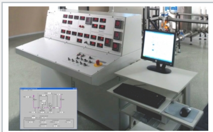
La estación de mando consta de consola de mando y adquisición de datos para el registro y evaluación cómodos de los ensayos