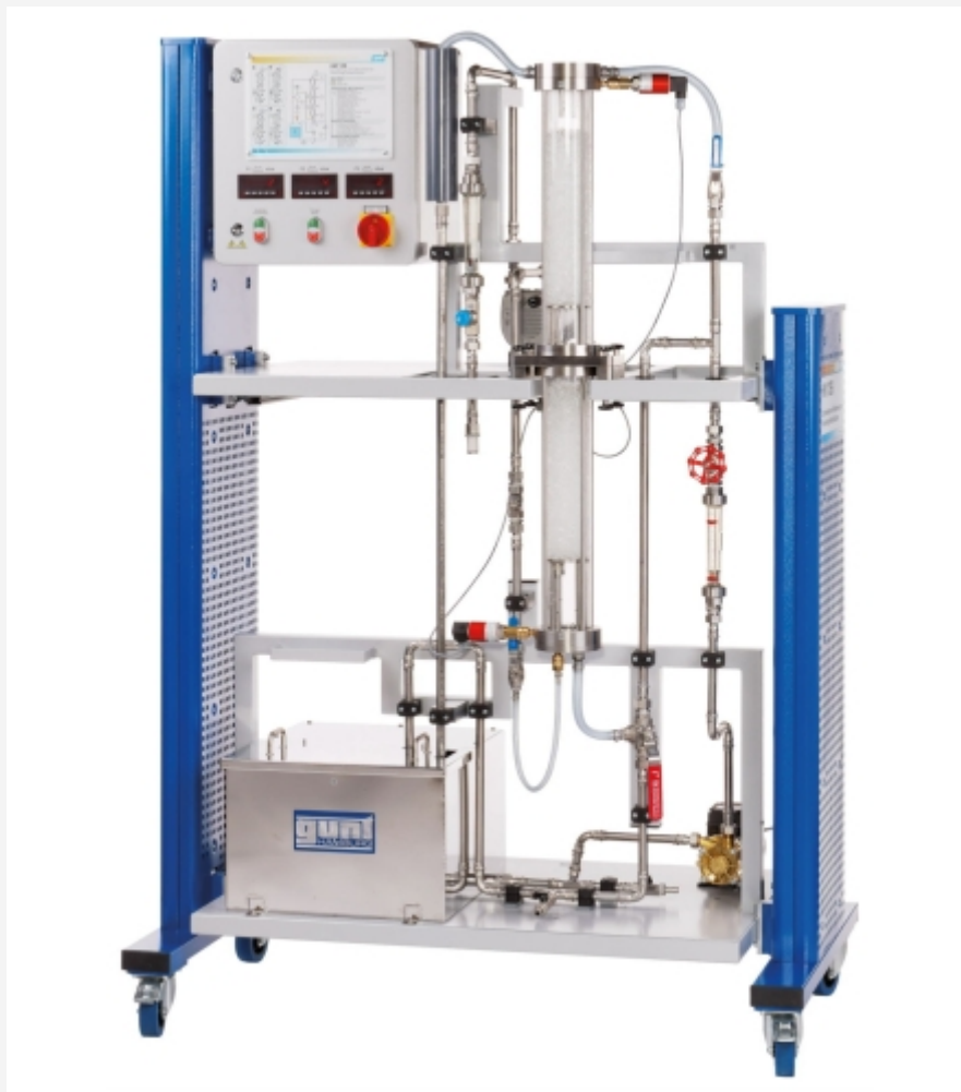
L'illustration montre un appareil similaire