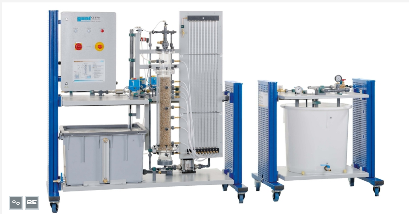
L'illustration montre: banc d'essai (à gauche) et unité d'alimentation (à droite).