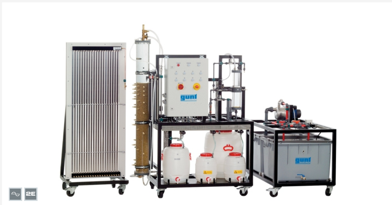
La ilustración muestra, desde la izquierda: panel de manómetro, banco de ensayos, unidad de alimentación