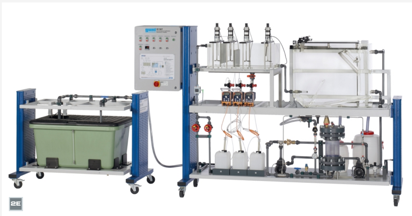
L'illustration montre: unité d'alimentation (à gauche) et banc d'essai (à droite)