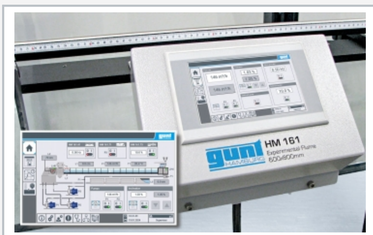
Panel táctil libremente posicionable