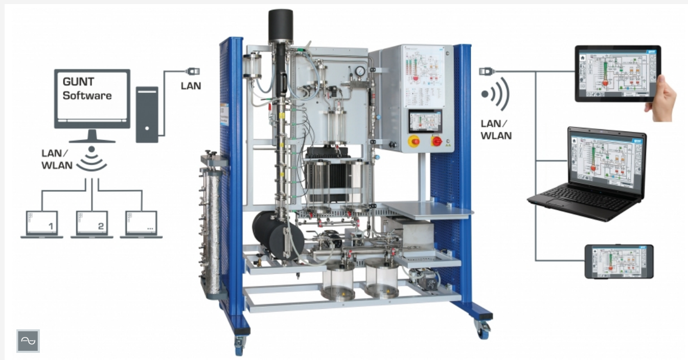
Die Abbildung zeigt CE 600 mit der eingebauten Siebbodenkolonne, Screen-Mirroring ist an verschiedenen Endgeräten möglich