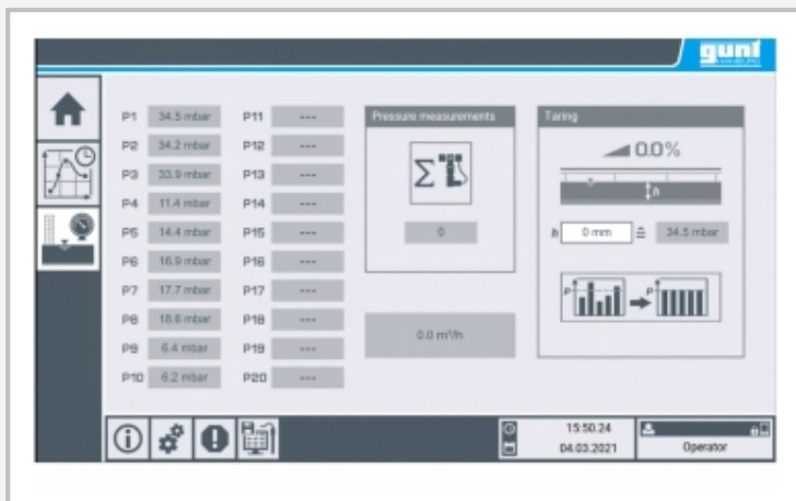
Affichage des hauteurs de pression sur l'écran tactile

1 coffret de commande de canal d'essai HM 162/HM 163 avec éléments d'affichage et de commande, 2 ordinateur (optionnel, non inclus), 3 amplificateur de mesure, 4 connexion d'un capteur de pression à point de mesure de canal d'essai, jusqu'à 10 capteurs de pression peuvent être connectés et affichés simultanément