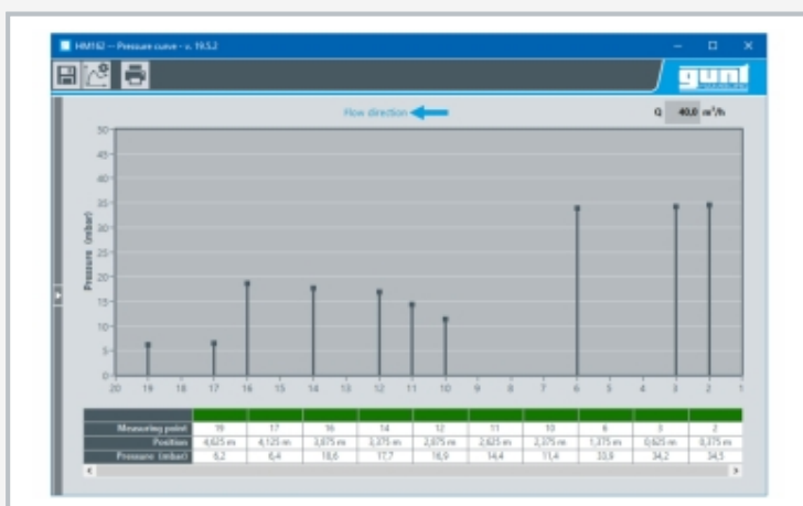
Capture d'écran du logiciel: le montage expérimental avec deux ouvrages de contrôle (contacteur au point de mesure 17, déversoir au points de mesure 10, 6 et 3)