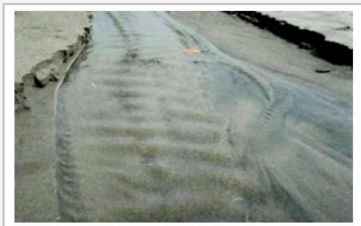
Érosion du sol et formation d'affouillements dans la nature