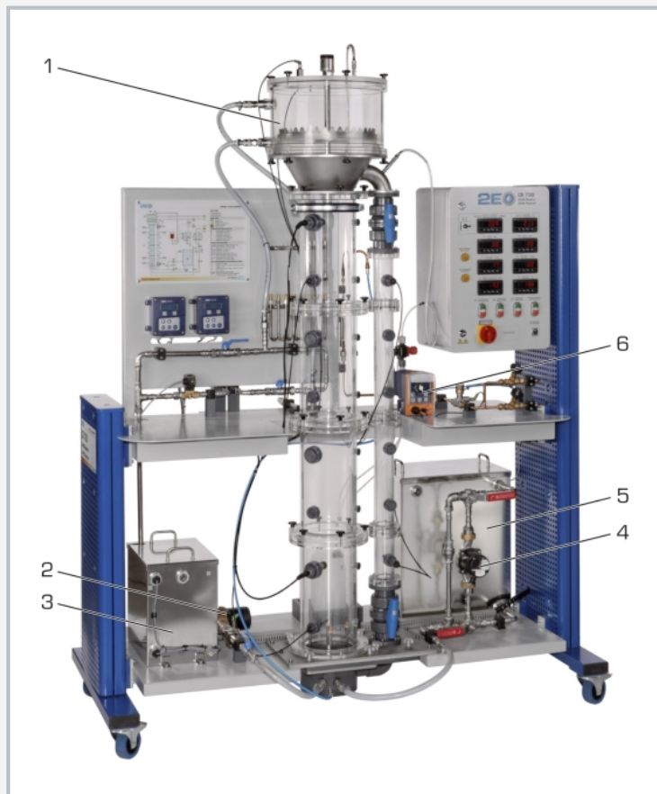
1 réacteur Airlift avec circuit externe, 2 pompe d'alimentation, 3 réservoir d'alimentation, 4 pompe de circulation, 5 réservoir de stockage, 6 pompe de dosage